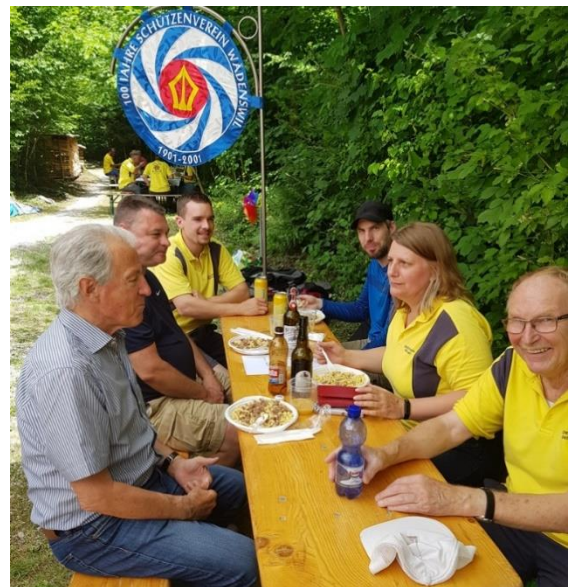
Der SV Wädenswil beim Mittagessen.