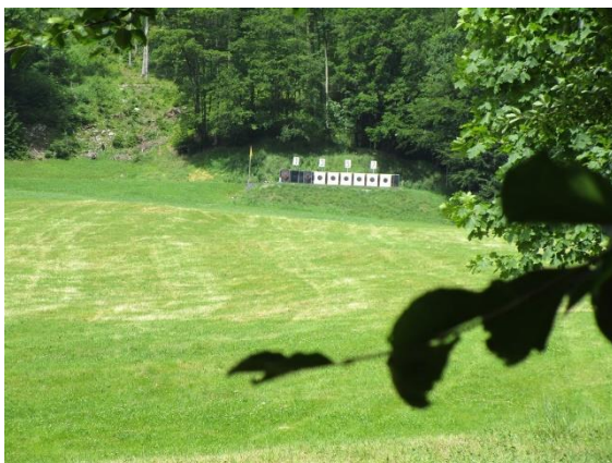
Scheiben im grellen Licht und Hitze von 30 Grad