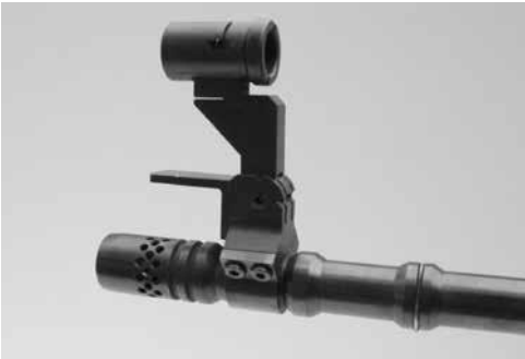
Bild 10: Kornträger als Visierverlängerung (Laufmontage), diverse Fabrikate