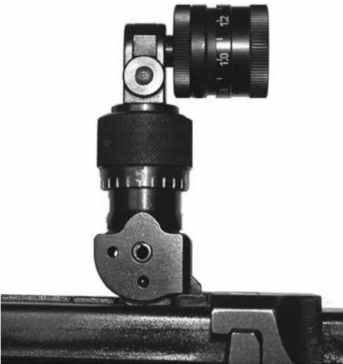
Bild 8: Irisblende zu Stgw 57 (mit und ohne Farbfilter), diverse Fabrikate

Gestattet sind alle im Fachhandel erhältlichen unveränderten Lochscheiben und Irisblenden mit oder ohne Farb- und Polarisationsfilter zur Montage auf dem unveränderten Ordonnanzdiopter. 01.01.2011