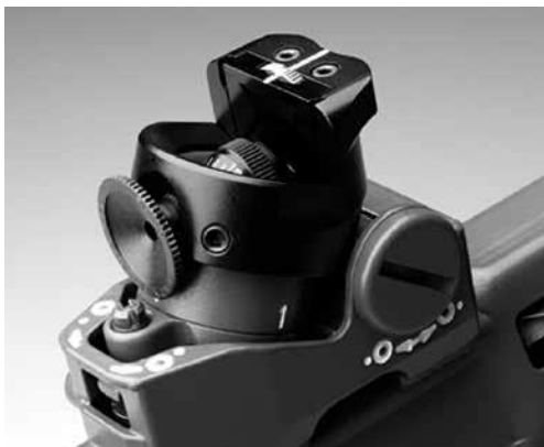
Bild 4: Excenter-Farbfilter mit Schiebekassette zu Stgw 90, Modell Grünig & Elmiger; Modell Wyss ähnlich