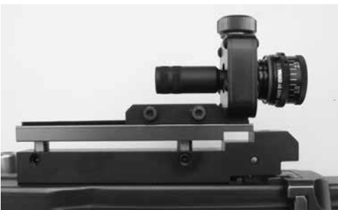
Bild 12: Dioptrträger zu Stgw 57 zur Aufnahme schussfester Diopter, diverse Fabrikate