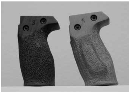
Bild 13: Pistolengriff Tactical zu Stgw 57 Bild 14: Standardgriffe 021101 und 021102 zu Stgw 57