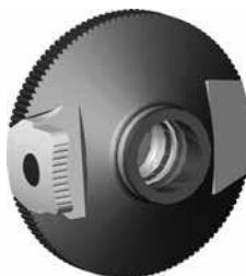
Bild 6: Rondelle für Farbfiltersystem an Irisblende zu Stgw 90 diverse Fabrikate