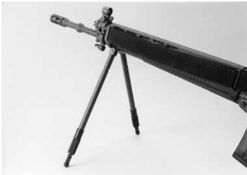
Bild 2: Verstellbare Zweibeinstütze zu Stgw 90, diverse Fabrikate