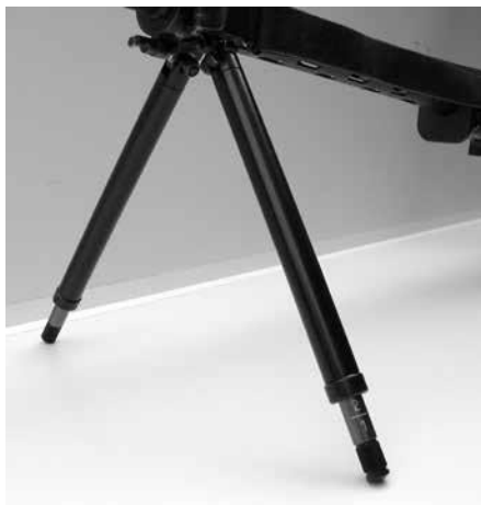
Bild 7: Verstellbare Zweibeinstütze zu Stgw 57, diverse Fabrikate