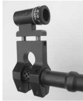
Bild 11: Kornträger als Visierverlängerung (Montage auf Mündungsbremse), diverse Fabrikate