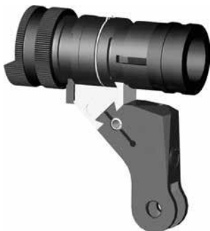
Bild 9: Universalkornträger zu Stgw 57 (Normalmontage), diverse Fabrikate