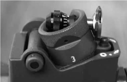
Bild 3: Irisblende zu Stgw 90 (mit und ohne Filter), diverse Fabrikate